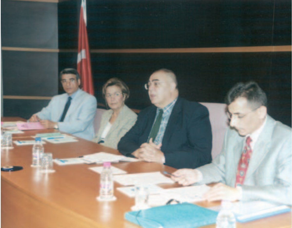
Toplantıdan bir görünüm

Üye kuruluş temsilcilerimizden gelen istekler dikkate alınarak, Sendikamız tarafından tertip edilen ve konusunda uzman kişilerin konuşmacı olarak katıldıkları toplantılardan bir tanesi de, 29.06.2001 tarihinde Sendikamız merkezinde yapılmıştır.