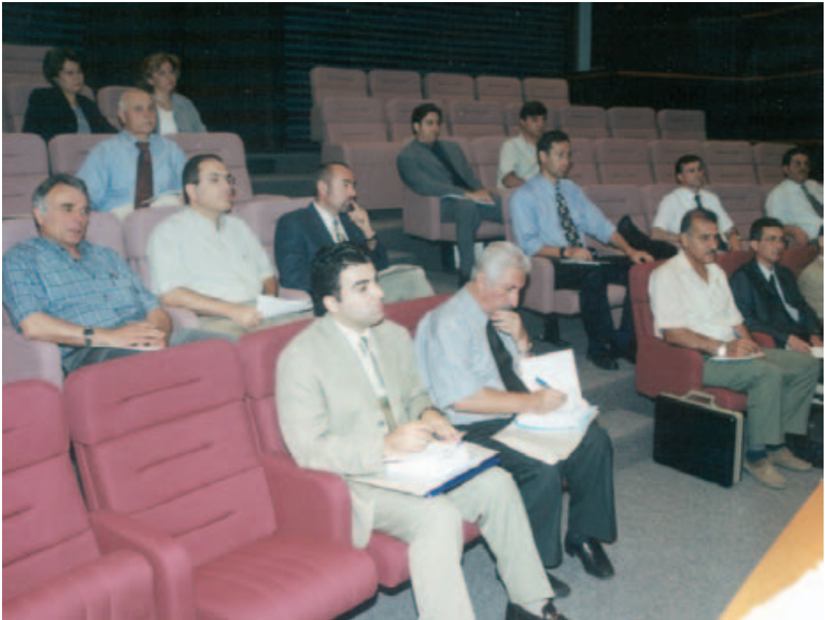
Toplantıdan bir görünüm