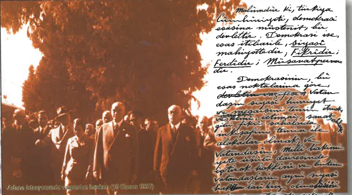
Adana İstisyonunda vagonları hareket ettirenler (19 Kasım 1907)

ÇİMENTO MÜSTAHSİLLERİ İŞVERENLERİ SENDİKASI YAYIN ORGANI